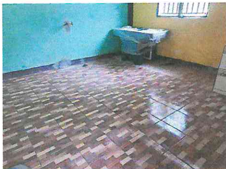
Foto1: Construcción de mesa de cemento para cocina