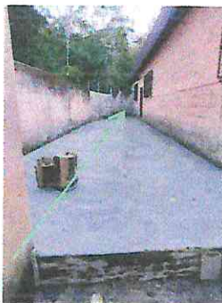
Foto 3: Construcción de bodega para almacenar y organizar el establecimiento para mejorar el ambiente.