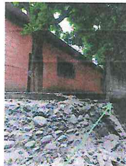
Foto 6: Instalación de tubería para agua que se utilizará en la cocina.

Observación: Si es necesario se pueden agregar hojas adicionales y actualizar el número de hojas.